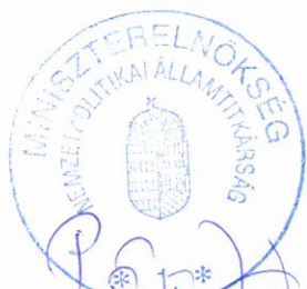
Potápi Árpád János államtitkár

A Bizottság felhívja a Bethlen Gábor Alapkezelő Zrt.-t, hogy a program megvalósításához szükséges forrás Bethlen Gábor Alapból történő átadása érdekében tegye meg a szükséges intézkedéseket.