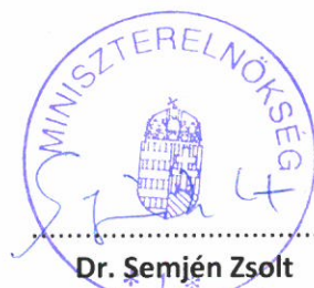
Dr. Semjén Zsolt miniszterelnök-helyettes